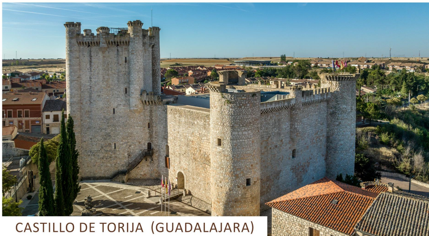
CASTILLO DE TORIJA (GUADALAJARA)

En esta ocasión os hemos preparado una excursión que os llevará de viaje a siglos pasados . La provincia de Guadalajara es una de las que más fortalezas posee en España , concretamente es la 3ª después de Jaén y Valladolid, zonas limítrofes de fronteras en la Edad Media donde se levantaron alcazabas árabes y castillos cristianos. Visitaremos lugares como el Torreón del Alamín de Guadalajara capital, el Castillo de Torija , la villa amurallada de Palazuelos , la cual es Conjunto Histórico Artístico y la Jadraque y su castillo . ¡No te lo pierdas!! Te esperamos.